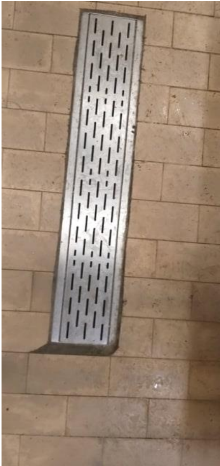
Sujidades no piso e ralo mantido sujo