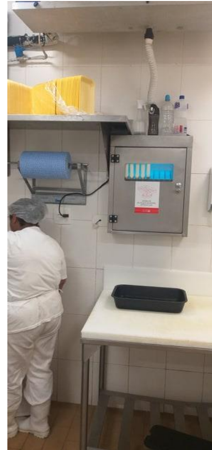
Pano descartável e bandejinhas descartáveis mantidas desprotegidas