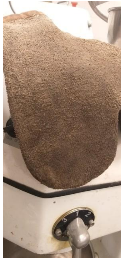
Luva suja em mau estado de conservação