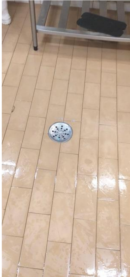
Ralo mantido aberto