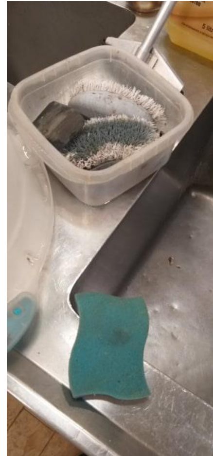
Escovinhas em mau estado de conservação